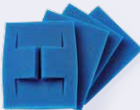
Protector para esquinas de bandejas GEMCORNER45