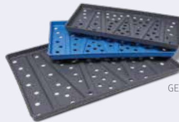
Bandeja de transporte rígida GEMTRAY3, GEMTRAY3L, GEMTRAY4