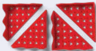
Protector reutilizable para esquinas de bandejas REGEMCORNER