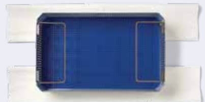
Revestimiento de papel para bandejas WGN400