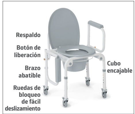
Silla retrete con brazos abatibles completamente montada