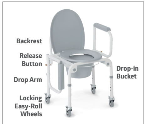
Fully Assembled Drop-arm Commode