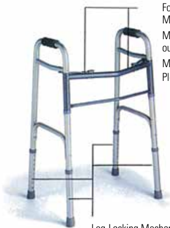
Folding/Locking Mechanisms Mécanismes de pliage ou de verrouillage Mecanismos de Plegado/Bloqueo